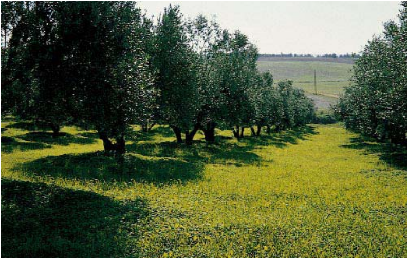
Una cubierta vegetal permanente, gestionada mediante la siega mecánica o el pastoreo, beneficia la conservación del suelo y de la flora y fauna silvestres. Es una práctica común en algunas zonas de Italia.