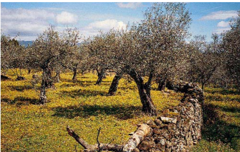
El mantenimiento de las paredes de piedra y las terrazas, típicas de muchos olivares tradicionales, requiere mucha mano de obra, y por ello es frecuente su descuido. Esto causa la pérdida paulatina de valores paisajísticos, y puede conducir a deslizamientos y al abandono.