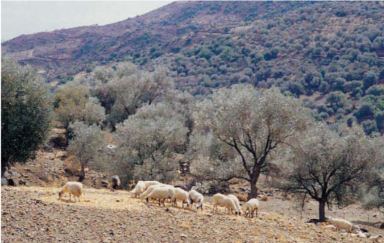
El pastoreo de ovejas es una práctica ambientalmente sensible de controlar las malas hierbas en el olivar. Sin embargo, las cargas excesivas pueden conducir al sobrepastoreo y erosión de suelos.