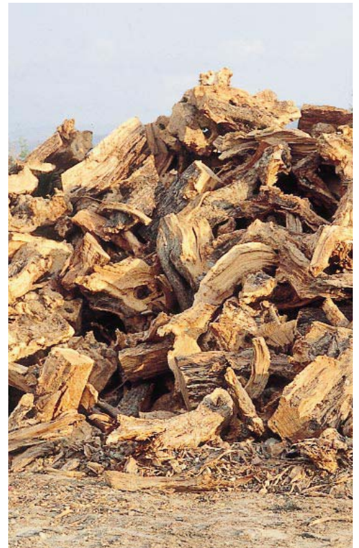
Éste es el destino de muchos olivos centenarios en Creta, como consecuencia de la tala de olivares tradicionales para dejar espacio a las nuevas plantaciones intensivas.